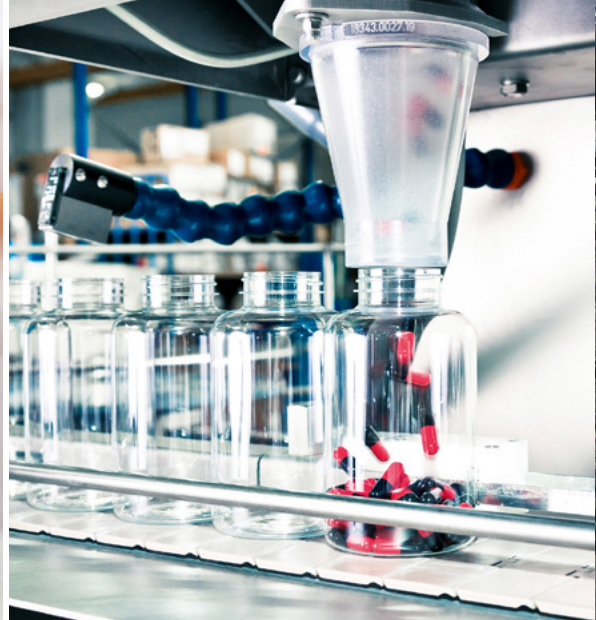
Produktentwicklung und Kapselabfüllung bei anona.

empfindlichen Vitamine zu erhalten. Hier gehören wir auch international zu den Pionieren.