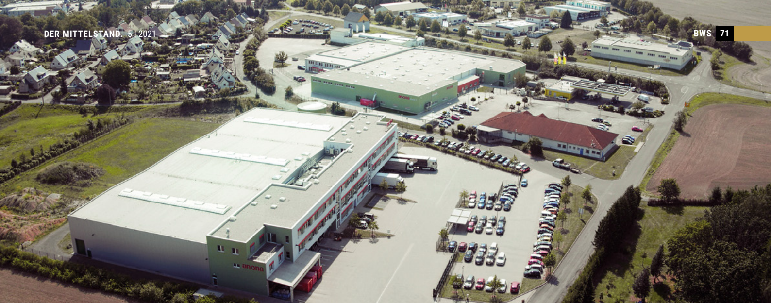
Luftansicht der anona Werke 2 und 3 in Colditz.

im März mehrere Tage durch einen Containerfrachter blockiert war.