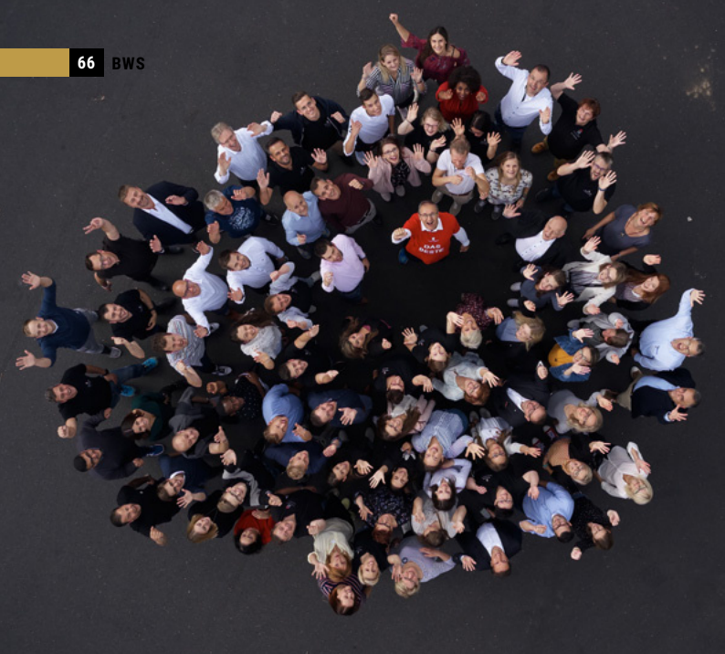
Das Team der Krieger + Schramm GmbH & Co. KG.

Zusatzfahrten, Arbeits- und Energieaufwand werden eingespart. Also werden viele unterschiedliche Ressourcen durch die richtige Vorabstrategie geschont.