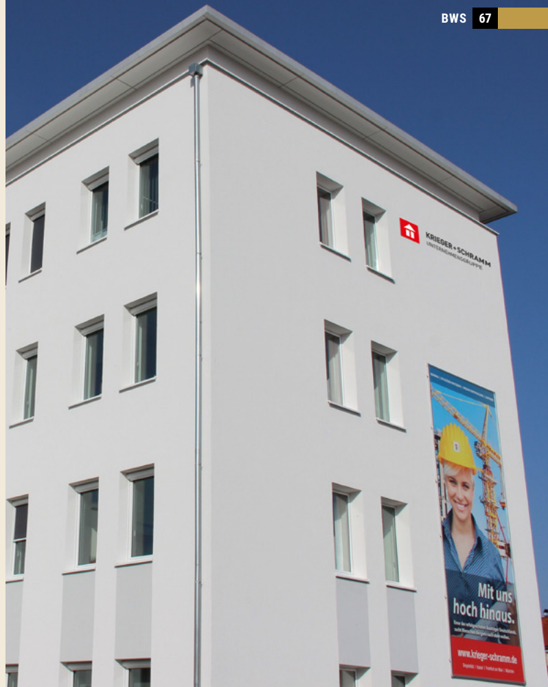
Der Hauptsitz der Krieger + Schramm GmbH & Co. KG im thüringischen Dingelstädt.